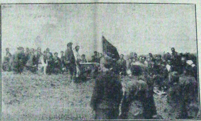
1924: Slujba la începutul lucrărilor piramidăriei din Ungheni Iași. În primul plan, în genuchi, Capitanul.

Dupa transformarea localitatii... Mănăstirea Dealului în... (Continuare din pag. 2-a)