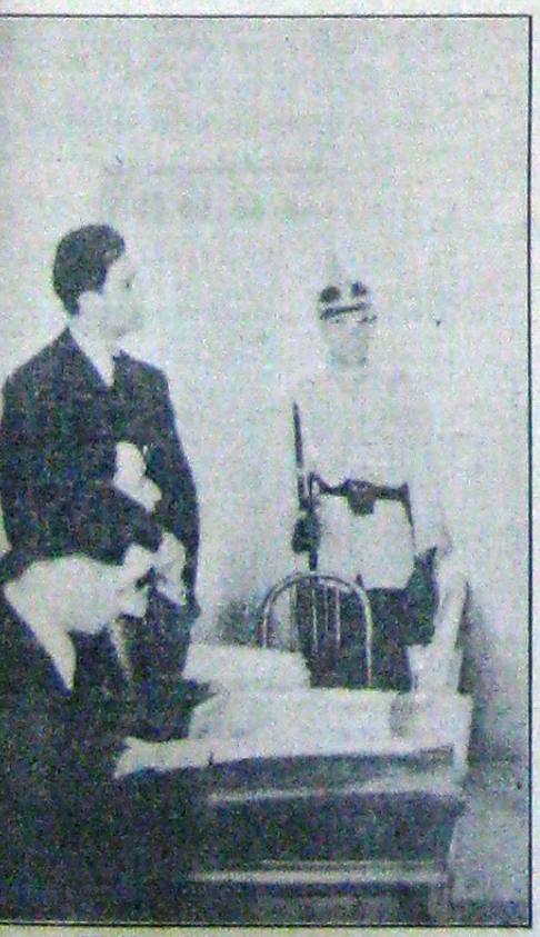
Căpitanul dând explicații