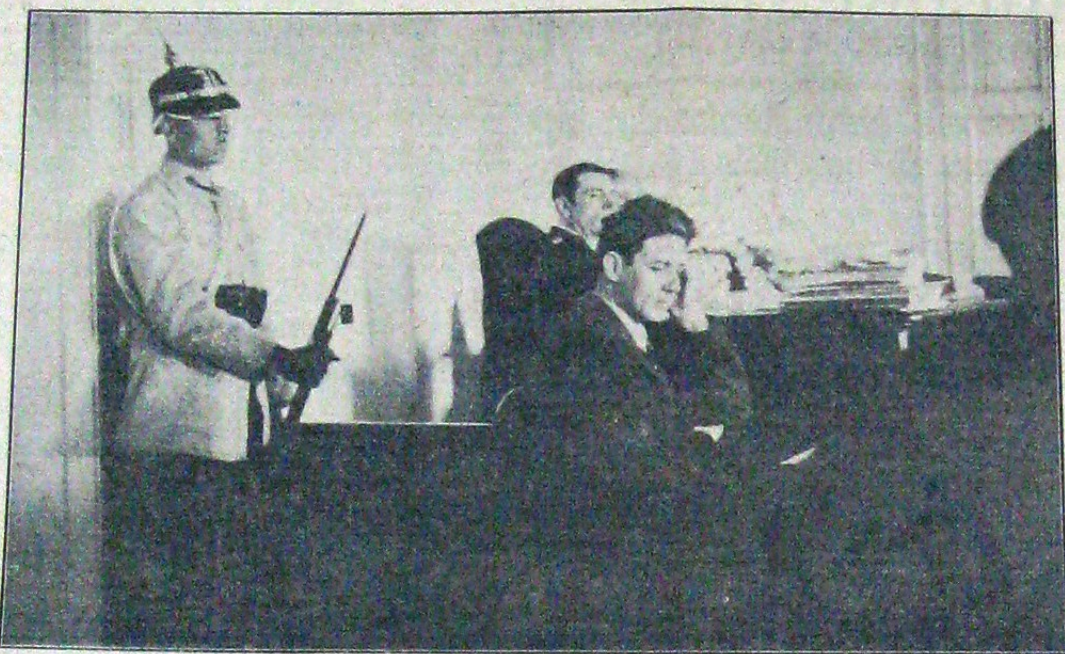
Căpitanul ascultând rechizițiul