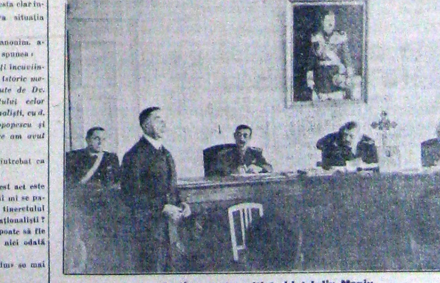
În timpul depozității d-lui Iuliu Maniu.